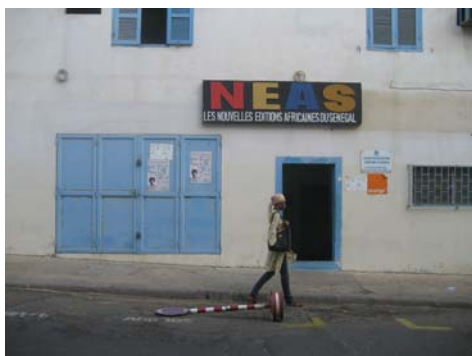
Figure 11: Maison d'édition NEAS

Par chance, les résultats de la récolte de dons ont dépassé nos espérances, ce qui nous a permis des dépenses supplémentaires au Sénégal : nous avons d'une part pu choisir des étagères métalliques, plus chères mais résistantes, et acheter des ordinateurs supplémentaires destinés aux élèves. Mais surtout, nous nous sommes rendues à la librairie des éditions NEAS 13 de Dakar pour y acheter un petit fonds de livres africains.