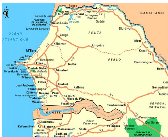
Figure 2: Carte du Sénégal

http://www.leboucheaoreille.net/carnets/Senegal.htm