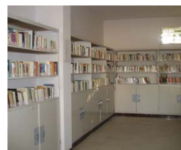
Figure 5: La bibliothèque du Lycée de Bambey