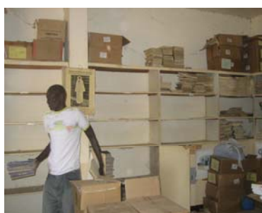
Figure 3: Déplacement de la collection

Nous avons muni la bibliothèque d'un ordinateur comprenant le logiciel Book'in 11 ainsi que l'encyclopédie Encarta et Encarta junior, toutes deux offertes gratuitement par le magasin d'informatique où nous avons acheté les ordinateurs. Par ailleurs, chaque ordinateur acheté a été pourvu du logiciel Book'in et des deux encyclopédies.