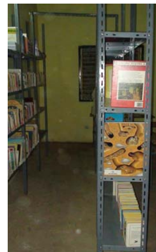
Figure 8: Etagères en métal