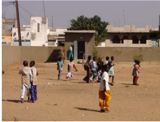
Figure 6: Cour de l'école de Fahu

La bibliothèque a été installée dans une ancienne salle de cours. Les locaux étaient simples mais spacieux et en bon état. L'électricité a été installée et les murs ont été repeints en jaune. Nous avons mis à disposition 4 ordinateurs : les élèves recevront désormais des cours d'informatique, et le bibliothécaire pourra gérer facilement les prêts.