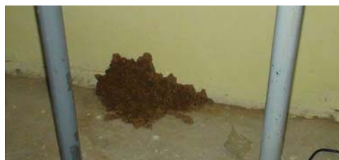
Figure 13: Apparition de termites après une nuit

Les facteurs naturels ne peuvent pas toujours être évités, la photo ci-contre montre des termites qui ont envahi la bibliothèque à l'école de Fahu, ceux-ci s'étaient propagés en l'espace d'une nuit. Un produit anti-termite a été acheté et pulvérisé plusieurs jours de suite.