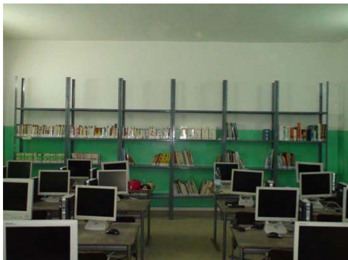
Figure 9: Bibliothèque et salle informatique de l'école Sainte-Bernadette

L'école de Sainte-Bernadette est une école privée catholique. Elle accueille des élèves de toute confession. La salle prévue pour la bibliothèque était une toute nouvelle salle d'informatique installée par l'école.