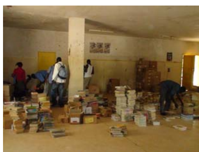
Figure 4: Tri et classement dans la salle de gym