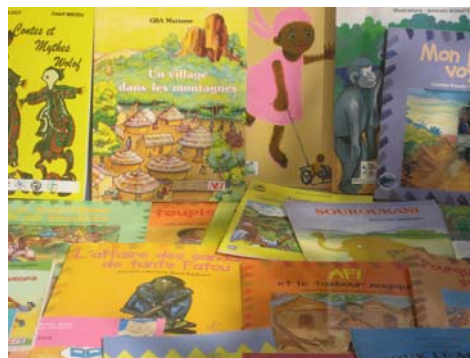
Figure 12: Albums africains