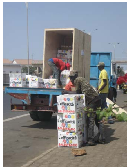
Figure 1: Gare routière à Dakar