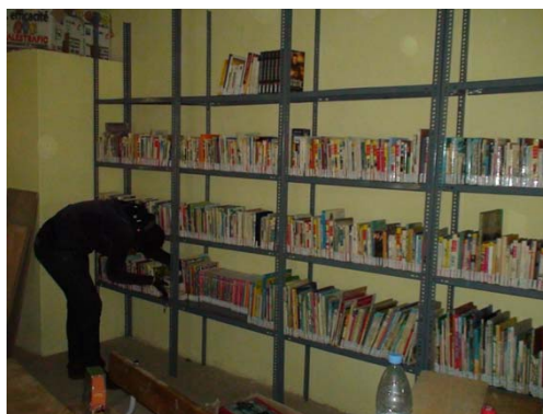
Figure 7: Bibliothèque de l'école de Fahu

Les étagères choisies sont en métal et donc résistantes. Elles ont été fixées le long du mur, une rangée supplémentaire a été installée devant ce qui permet un passage entre les deux.