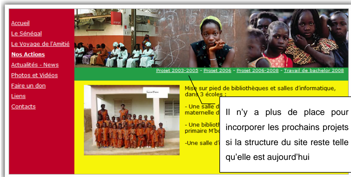
Figure 15: Capture d'écran du site web actuel

Une association oeuvrant pour les bibliothèques du Sénégal