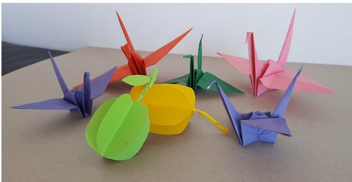
Figure 20 : Origami, oiseaux et caramboles