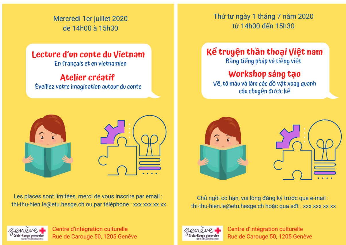
Figure 19 : Flyers en français et en vietnamien

recense entre autres des activités à faire à Genève. Finalement, une promotion via les réseaux personnels et professionnels a été faite.