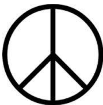
Figure 2 - Logo « Peace and Love » de mai 68