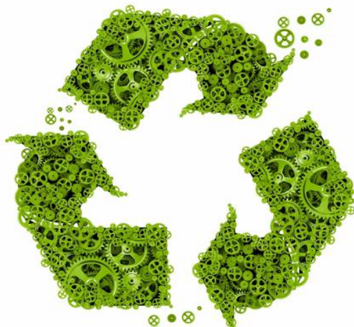
Figure 1 : illustration page de garde

La construction du lien social dans des activités médiatrices au sein d'organisations mettant l'écologie au centre de leurs intérêts