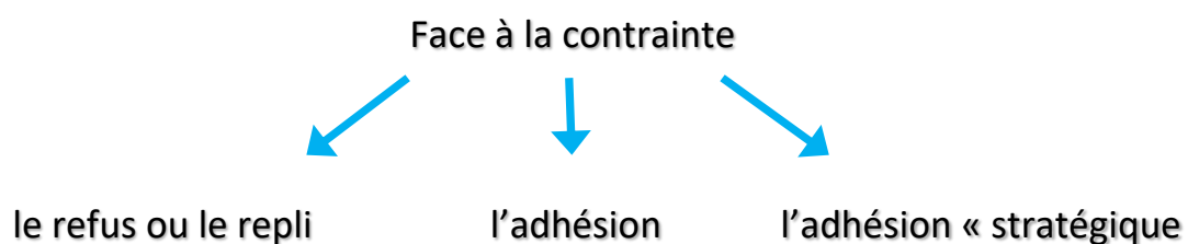
Figure 1: réactions face à l'aide contrainte

Comme j'ai déjà pu l'observer lors de ma formation pratique à la protection de l'enfance, chaque bénéficiaire réagit à sa propre manière face à une aide imposée. Soit il la refuse et se replie, soit il accepte l'aide en reconnaissant avoir conscience de son problème, soit il joue le jeu et feint de vouloir l'aide. En effet, c'est ce que Guy Hardy développe dans l'un de ses ouvrages (Hardy, 2001). Ayant eu connaissance de passablement de cas cliniques, j'ai sélectionné trois situations que j'ai rencontrées afin d'illustrer sa théorie.