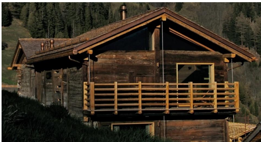
Figure 3: Extérieur de la grange Barbey