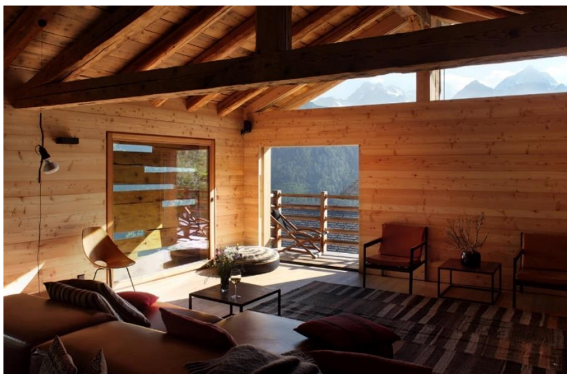
Figure 4: Intérieur de la grange Barbey