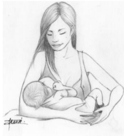
Figure. 39.5. Position dite « Madone ».