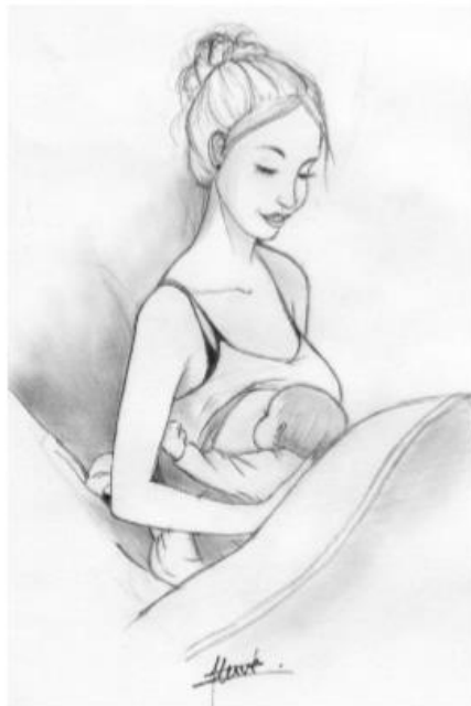
Figure. 39.4. Position dite « en ballon de rugby ».