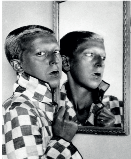
Jersey Heritage, Claude CAHUN, 1928.

lel précise en outre que l'invisibilisation des personnes non-binaires est « étroitement liée au processus de colonisation, iels n'étaient pas qu'ignoré·e·s, mais “reconverti·e·s” de force aux principes binaires, car les différents genres qu'iels incarnaient étaient perçus comme “sauvages”. L'imposition des normes binaires dans les sociétés non-blanches pré-coloniales peut donc s'apparenter au processus bien connu de “désensauvagement” tel que prôné à l'époque. »