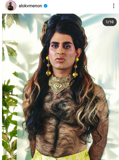
Alok VAID-MENON, 2021.