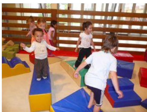
Figure 1 : Motricité globale

« La motricité globale comprend tout ce qui concerne le contrôle de l'ensemble du corps tant en mouvement qu'à l'état de repos. Autrement dit, elle désigne tout ce qui touche l'acquisition et la maîtrise de positions et de déplacements. L'expression motricité globale s'applique ainsi à l'ensemble des réponses motrices qui assurent l'harmonie et l'aisance globale du corps dans les activités corporelles de la vie courante, de même que dans les activités ludiques, sportives et d'expression. » 16