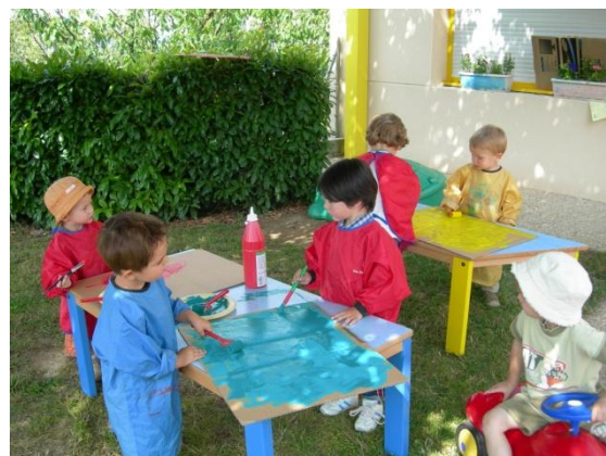
Figure 9 : Activité d'expression

Ce sont les activités qui permettent à l'enfant de s'exprimer. On y trouve le graphisme (sous différentes formes : peinture, dessin), le théâtre, le chant, la danse, les jeux de rôles, le mime, etc. Les activités d'expression permettent à l'enfant d'explorer son imagination, son schéma corporel, sa coordination, son équilibre, son intellect, ses émotions, sa mémoire, grâce à l'imitation, à la représentation et à la symbolisation.