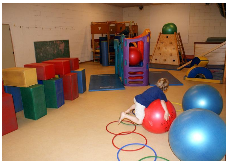
Figure 4 : Salle de psychomotricité

Dans une salle de psychomotricité, nous pouvons donc trouver des gros ballons (ils permettent de travailler l'équilibre, la confiance en soi et en l'autre), des tunnels (pour passer dedans et marcher à quatre pattes), une piscine à boules, des formes en mousse permettant de construire un parcours psychomoteur, des cerceaux, des foulards, des sacs de grains (pour travailler les poids), des balles de différentes tailles et de différentes textures, des anneaux de différents poids, des échelles, des espaliers, des toboggans, un parachute (pour une activité en groupe), etc.