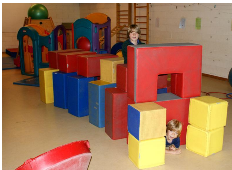
Figure 5 : Salle de psychomotricité. Forme en mousse pour un parcours psychomoteur