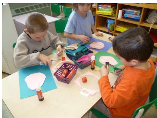
Figure 2 : Motricité fine

« La motricité fine concerne les mouvements fins et minutieux, requérant de la précision. Elle fait appel au contrôle de certains membres en particulier (petits muscles) et à la perception, pour guider le mouvement dans l'exécution d'une tâche motrice. » 18