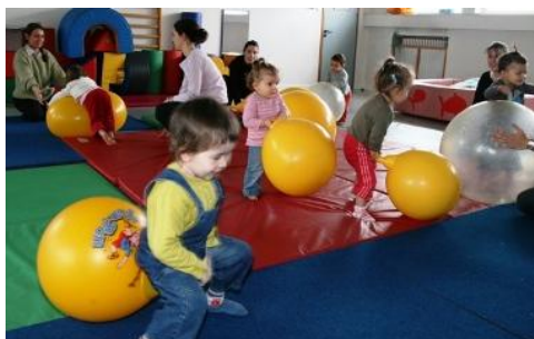
Figure 8 : Activité dynamique