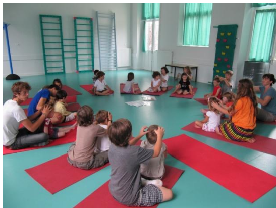
Figure 10 : Activité de détente