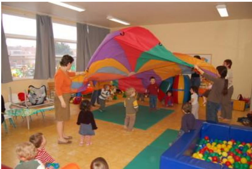
Figure 6 : Le parachute