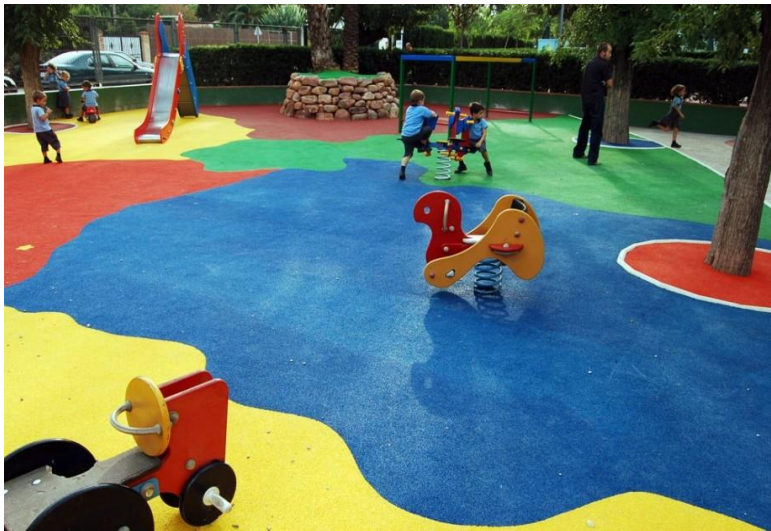
Figure 7 : Place de jeux avec un sol de différentes couleurs